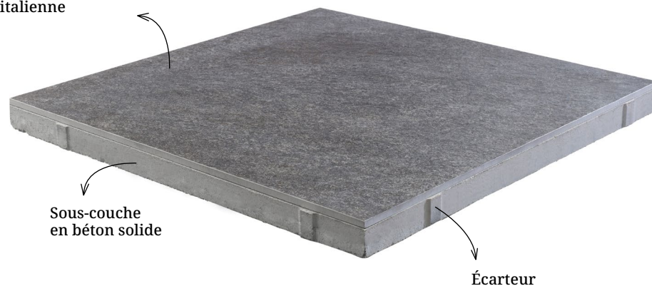
Sous-couche en béton solide