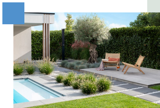
Dalle de céramique italienne

Cette dalle hybride combine la beauté naturelle de la céramique italienne de qualité supérieure avec la technologie moderne du béton. Ce mélange unique garantit un look intemporel et des années de plaisir. La dalle est entièrement assemblée chez Marlux à Tessenderlo.