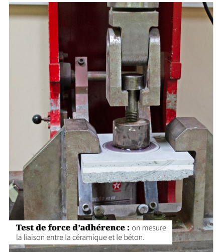
Test de force d'adhérence : on mesure la liaison entre la céramique et le béton.

Chez Marlux, nous réunissons depuis plus de 20 ans différents matériaux, tels que la pierre naturelle et le béton, en un seul produit. Cette connaissance et cette expertise nous permettent de proposer des dalles hybrides de la meilleure qualité.