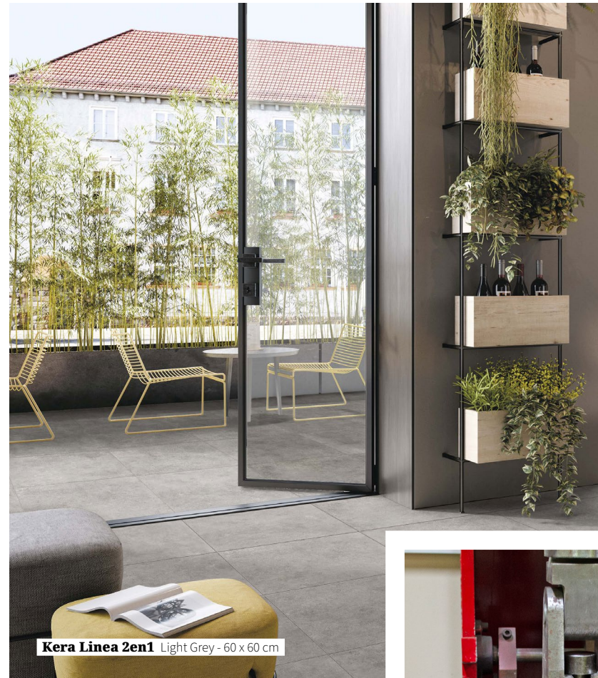
Kera Linea 2en1 Light Grey - 60 x 60 cm