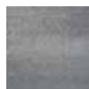
Nuance Light Grey