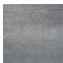
Nuance Light Grey